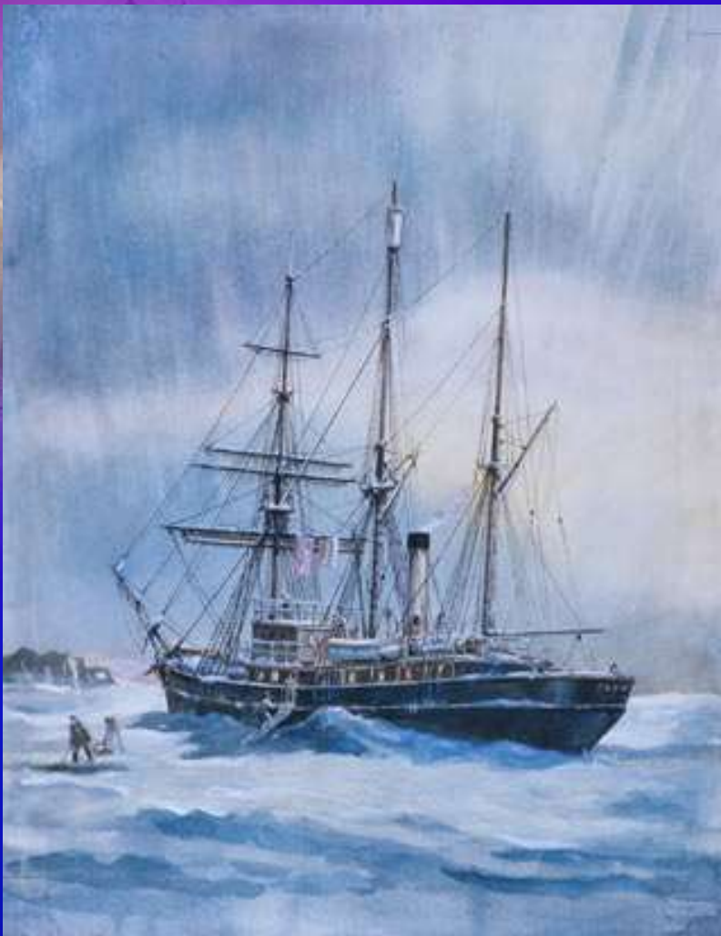
«Святой Фока» Судно экспедиции Г. Я. Седова